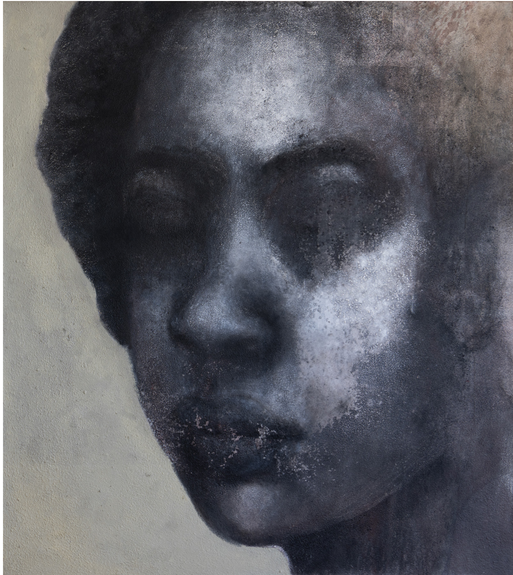
خامات متعددة على قماش Mixed media on canvas 180 x 160 cm