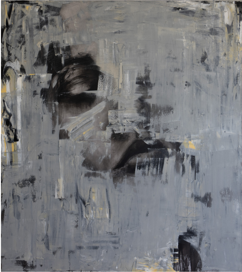
خامات متعددة على قماش Mixed media on canvas 180 x 160 cm