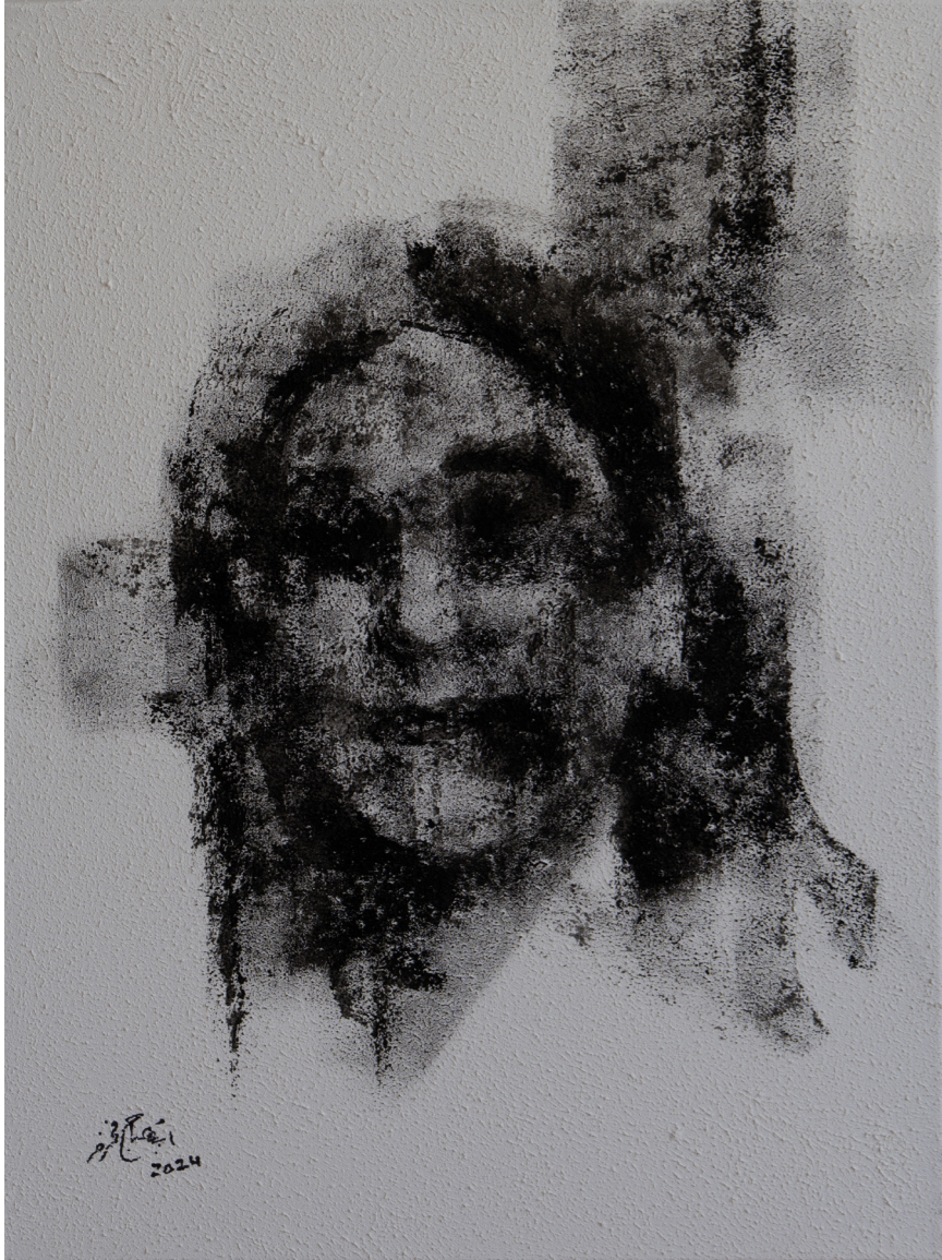
خامات متعددة على قماش Mixed media on canvas 45 x 60 cm