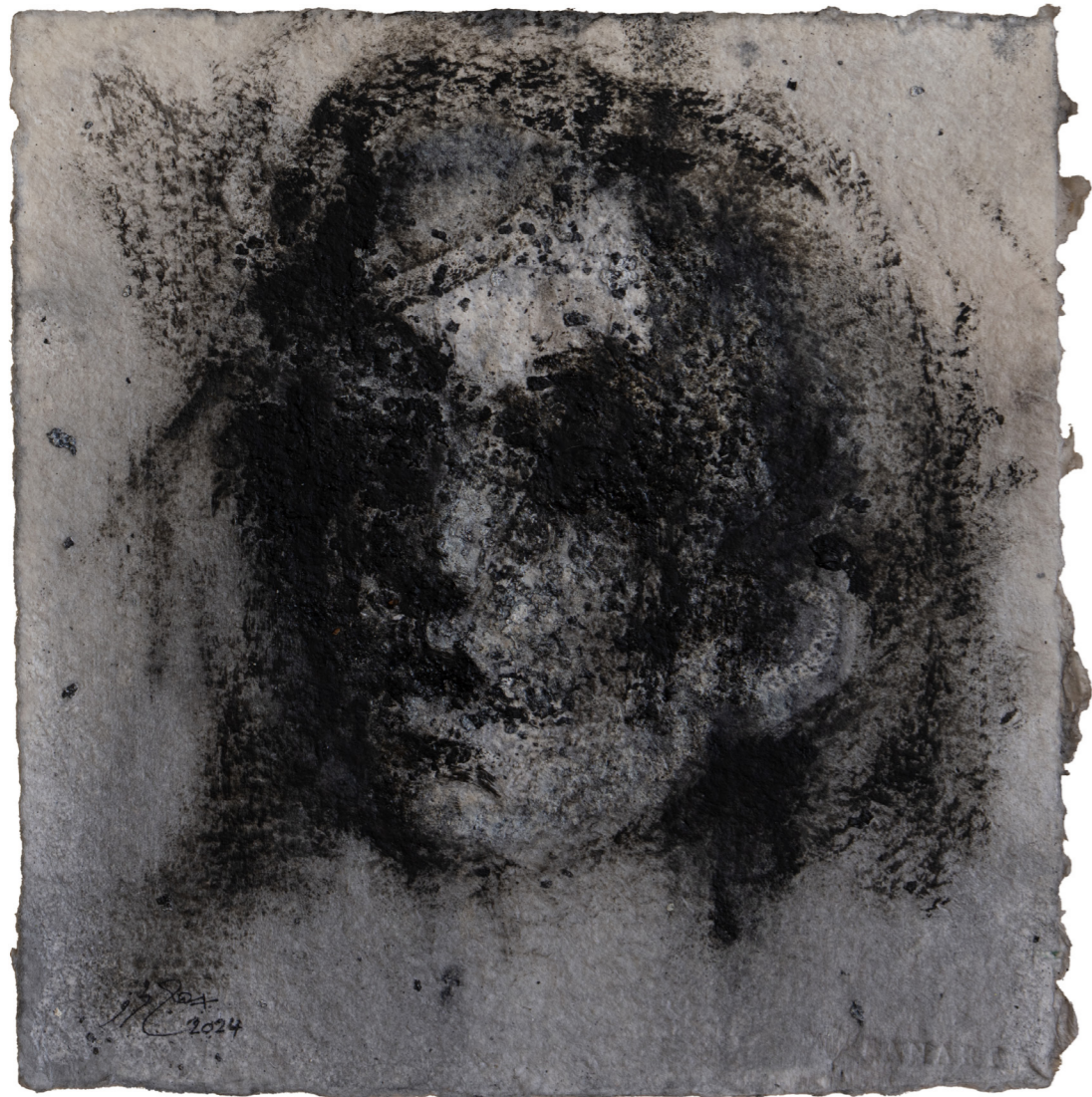
خامات متعددة على ورق مصنوع يدويًا Mixed media on handmade paper 30 x 26 cm