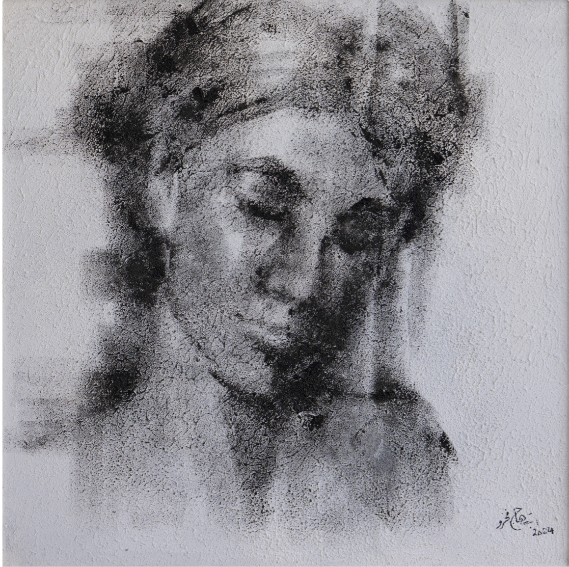
خامات متعددة على قماش Mixed media on canvas 45 x 60 cm