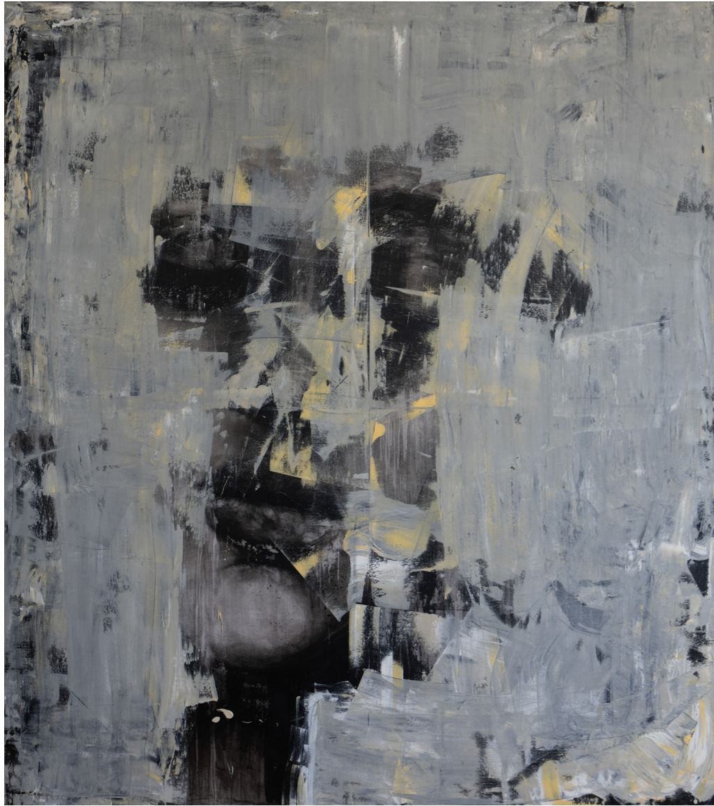
خامات متعددة على قماش Mixed media on canvas 180 x 160 cm