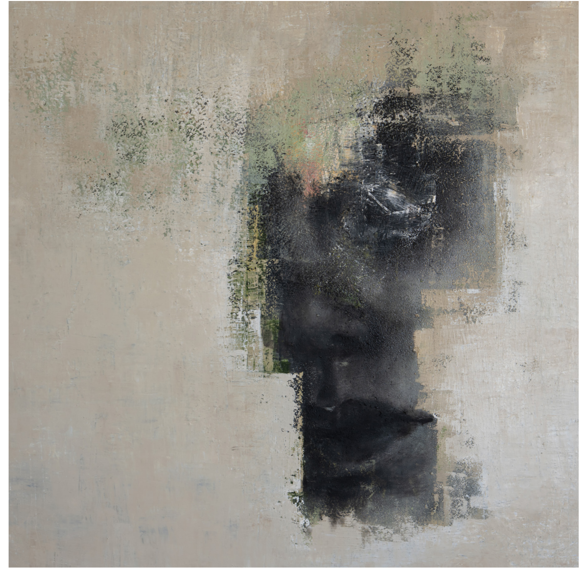
خامات متعددة على قماش Mixed media on canvas 120 x 120 cm