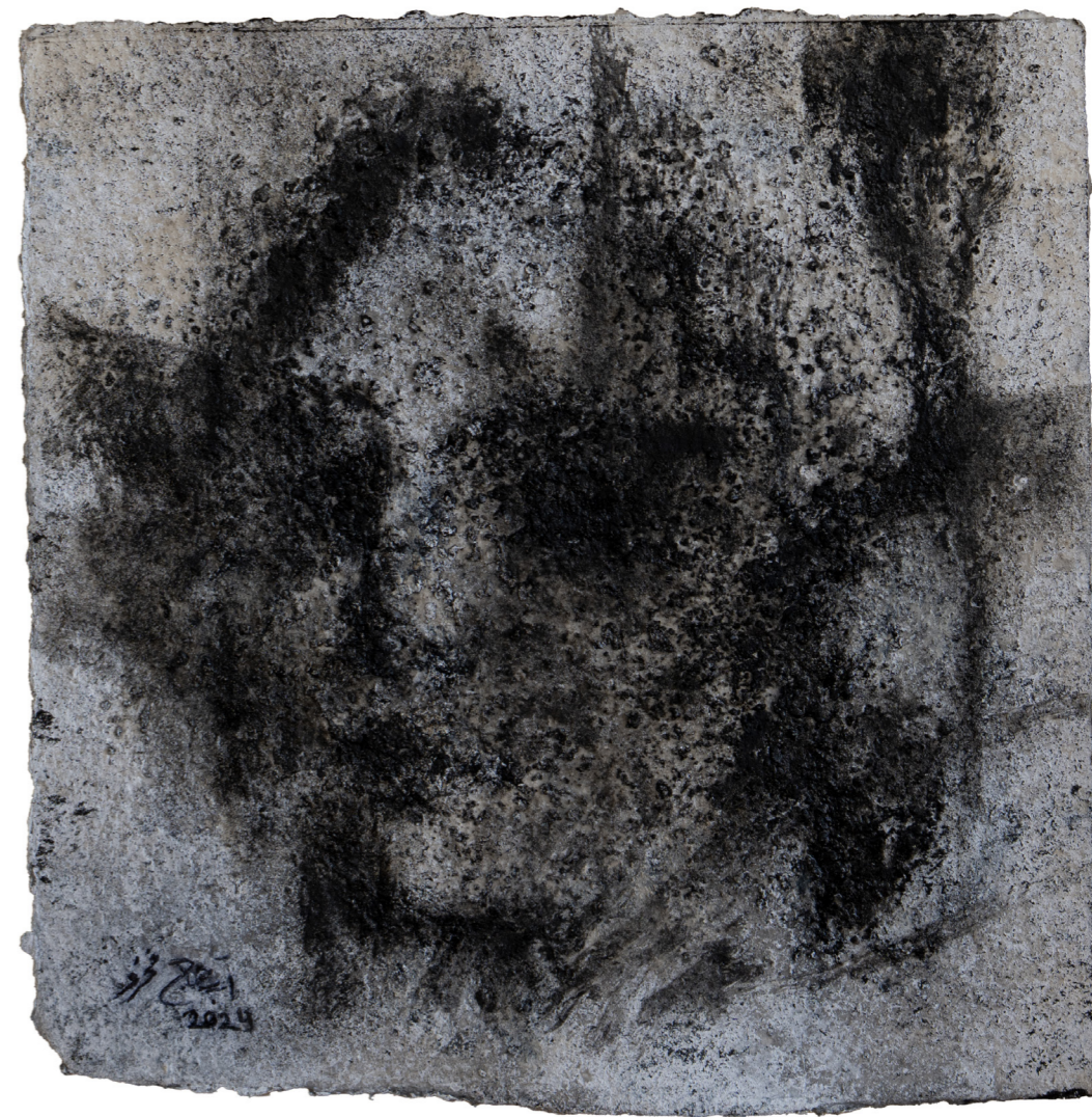
خامات متعددة على ورق مصنوع يدويًا Mixed media on handmade paper 30 x 30 cm