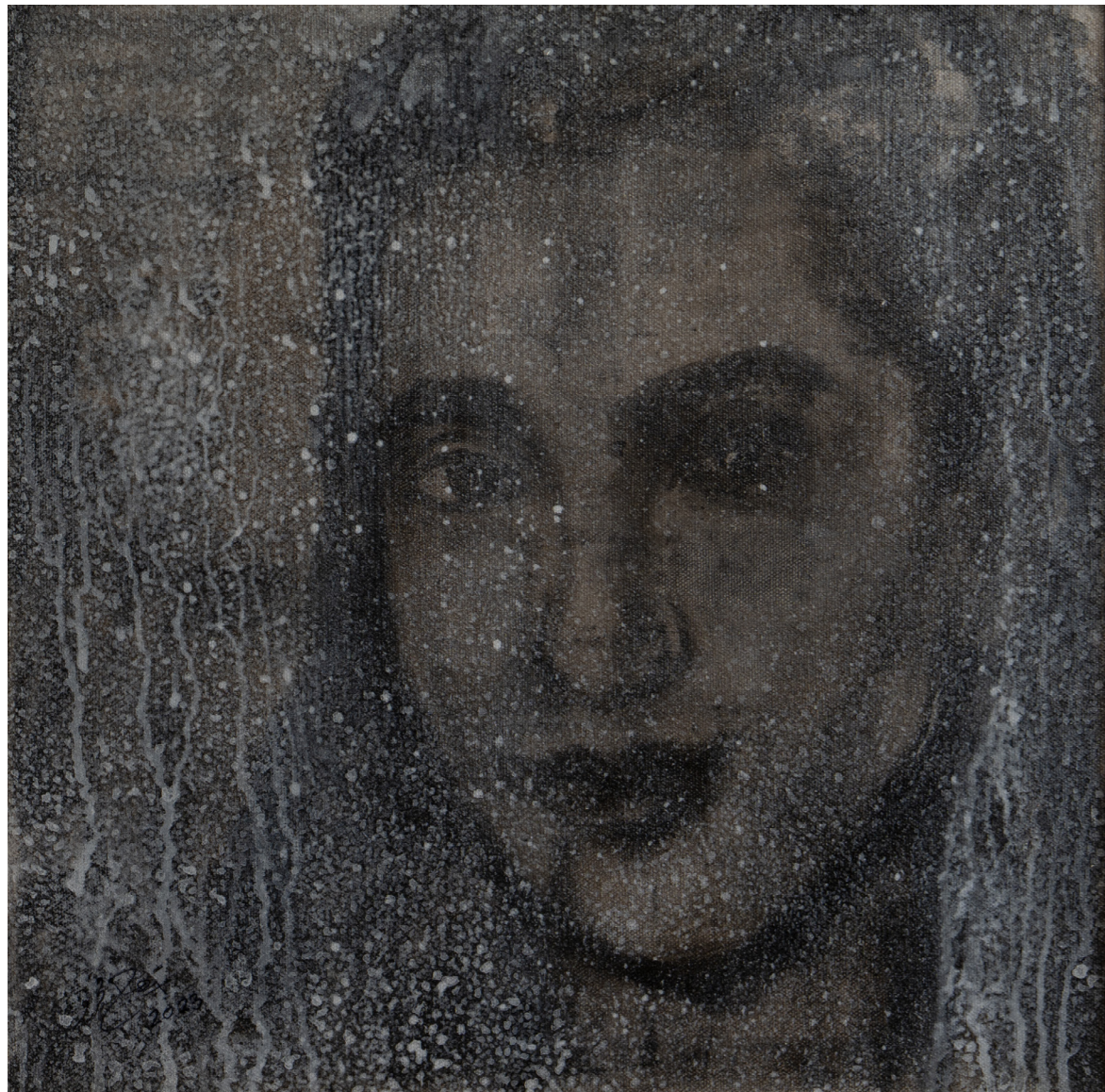
خامات متعددة على قماش Mixed media on canvas 40 x 40 cm