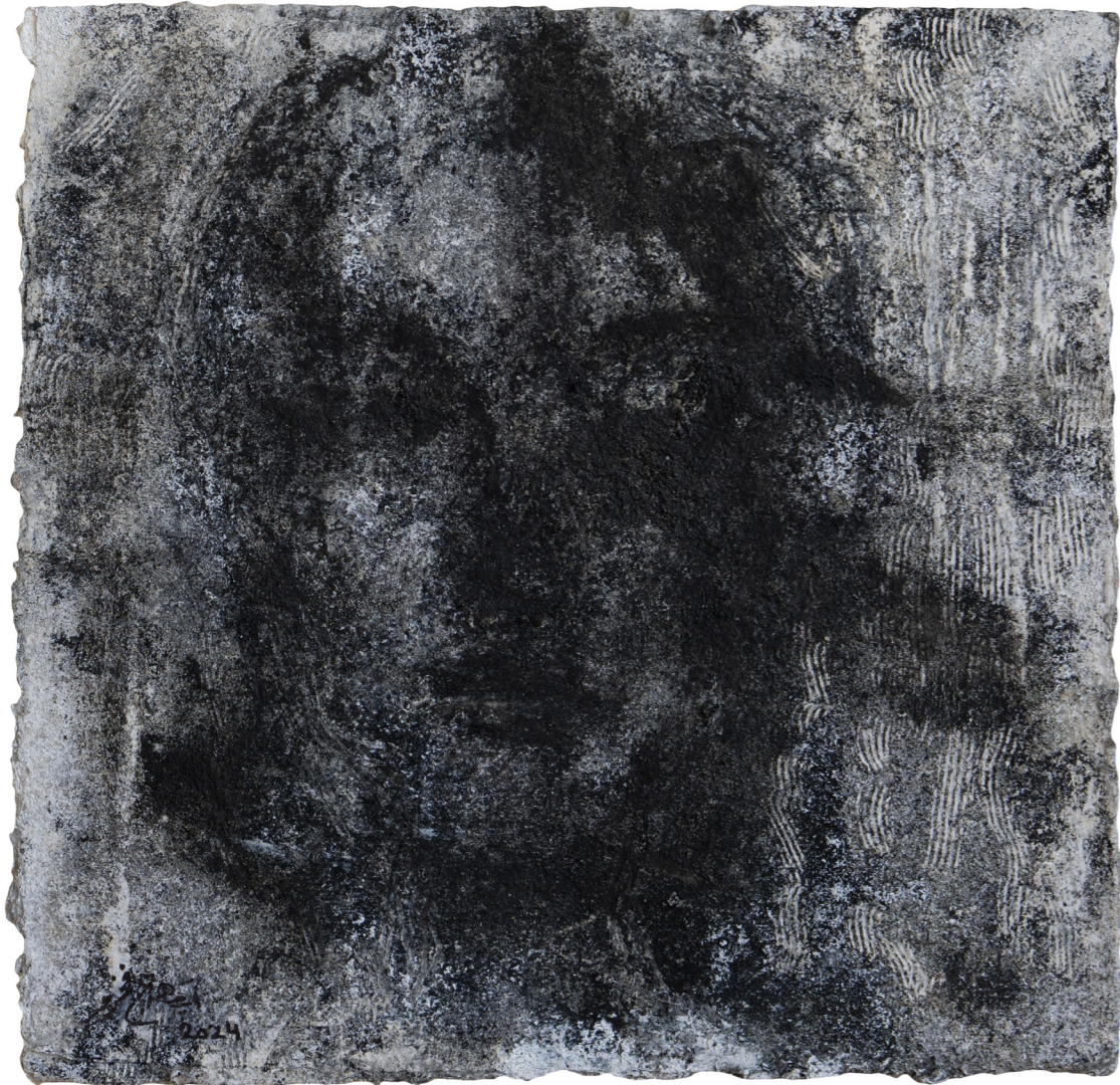
خامات متعددة على ورق مصنوع يدويًا Mixed media on handmade paper 30 x 30 cm