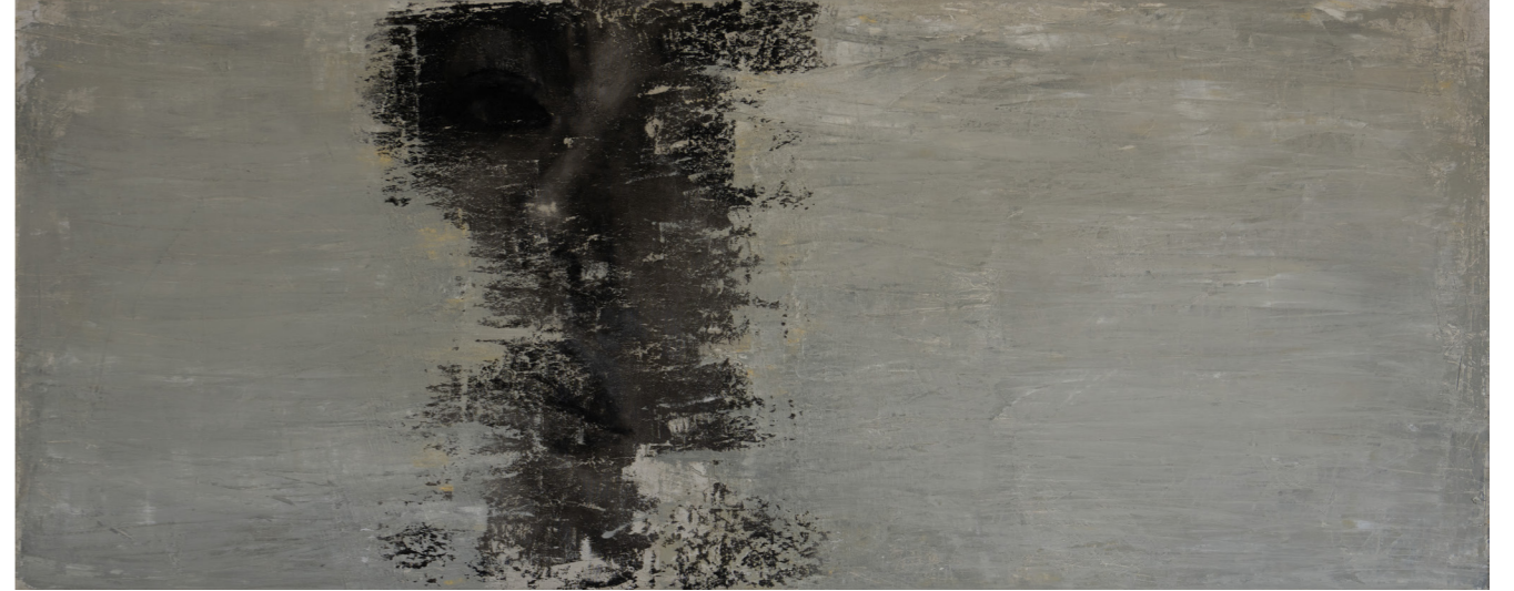
خامات متعددة على قماش Mixed media on canvas 200 x 80 cm