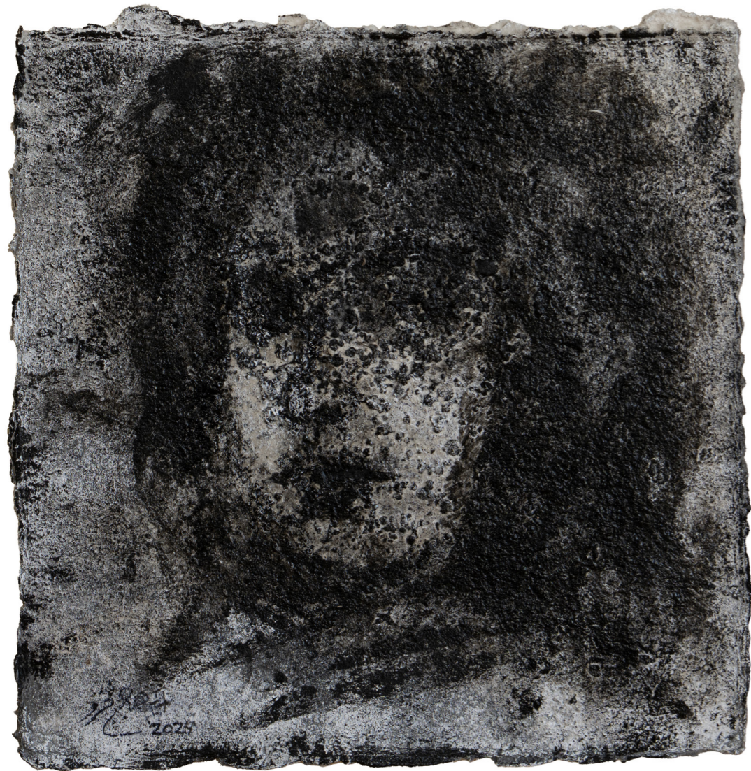
خامات متعددة على ورق مصنوع يدويًا Mixed media on handmade paper 30 x 30 cm