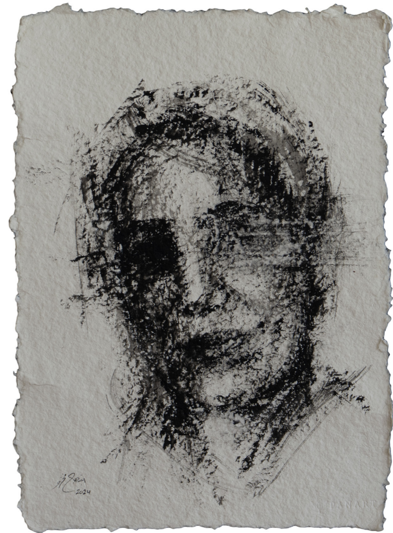
خامات متعددة على ورق مصنوع يدويًا Mixed media on handmade paper 43 x 30 cm