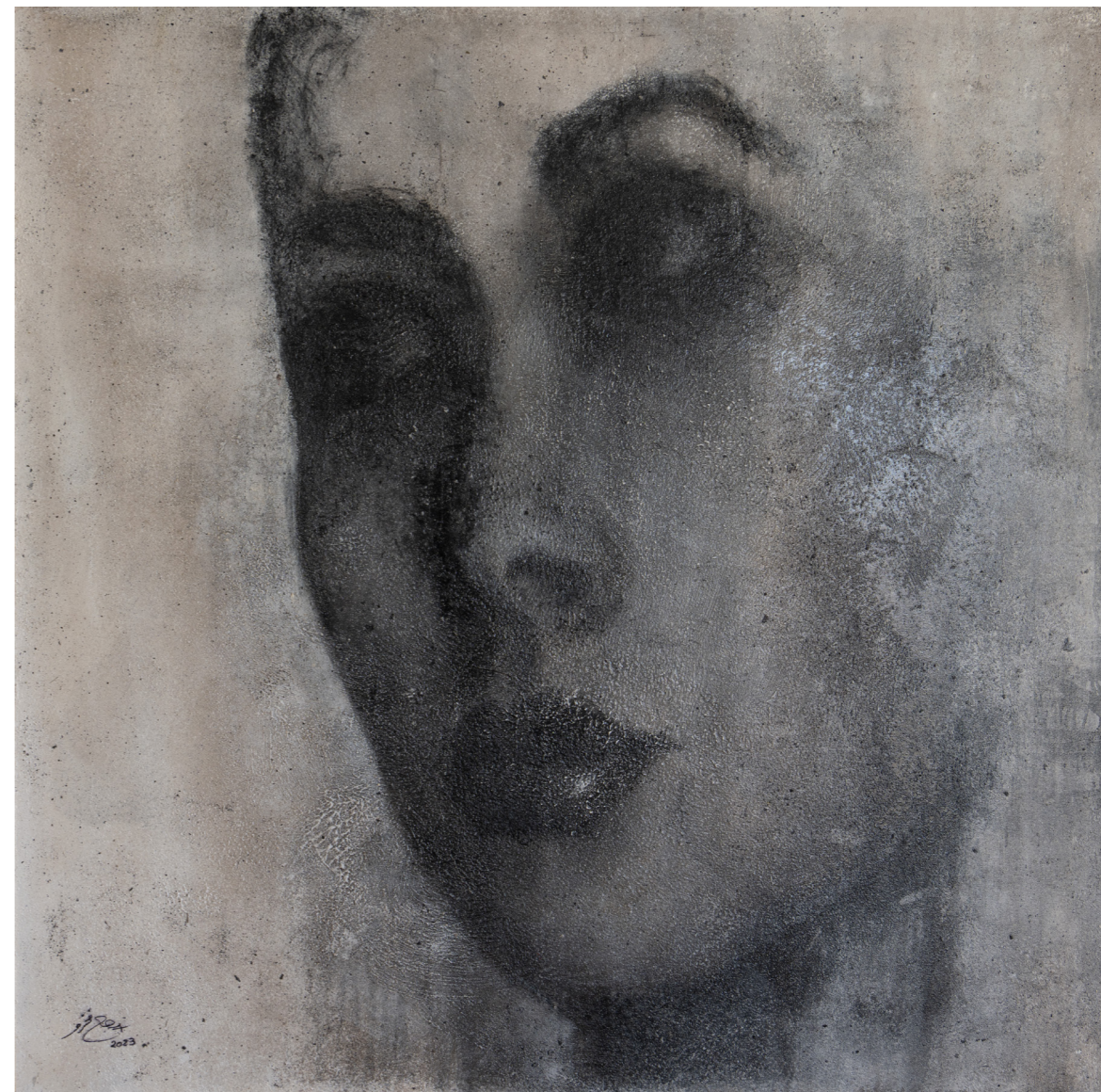
خامات متعددة على قماش Mixed media on canvas 120 x 120 cm