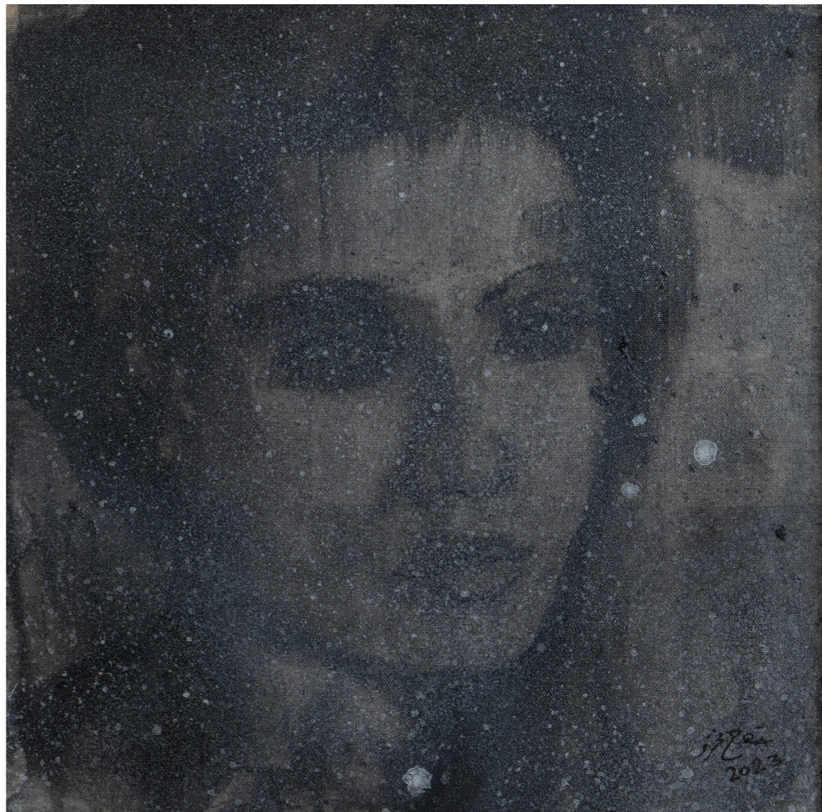
خامات متعددة على قماش Mixed media on canvas 40 x 40 cm