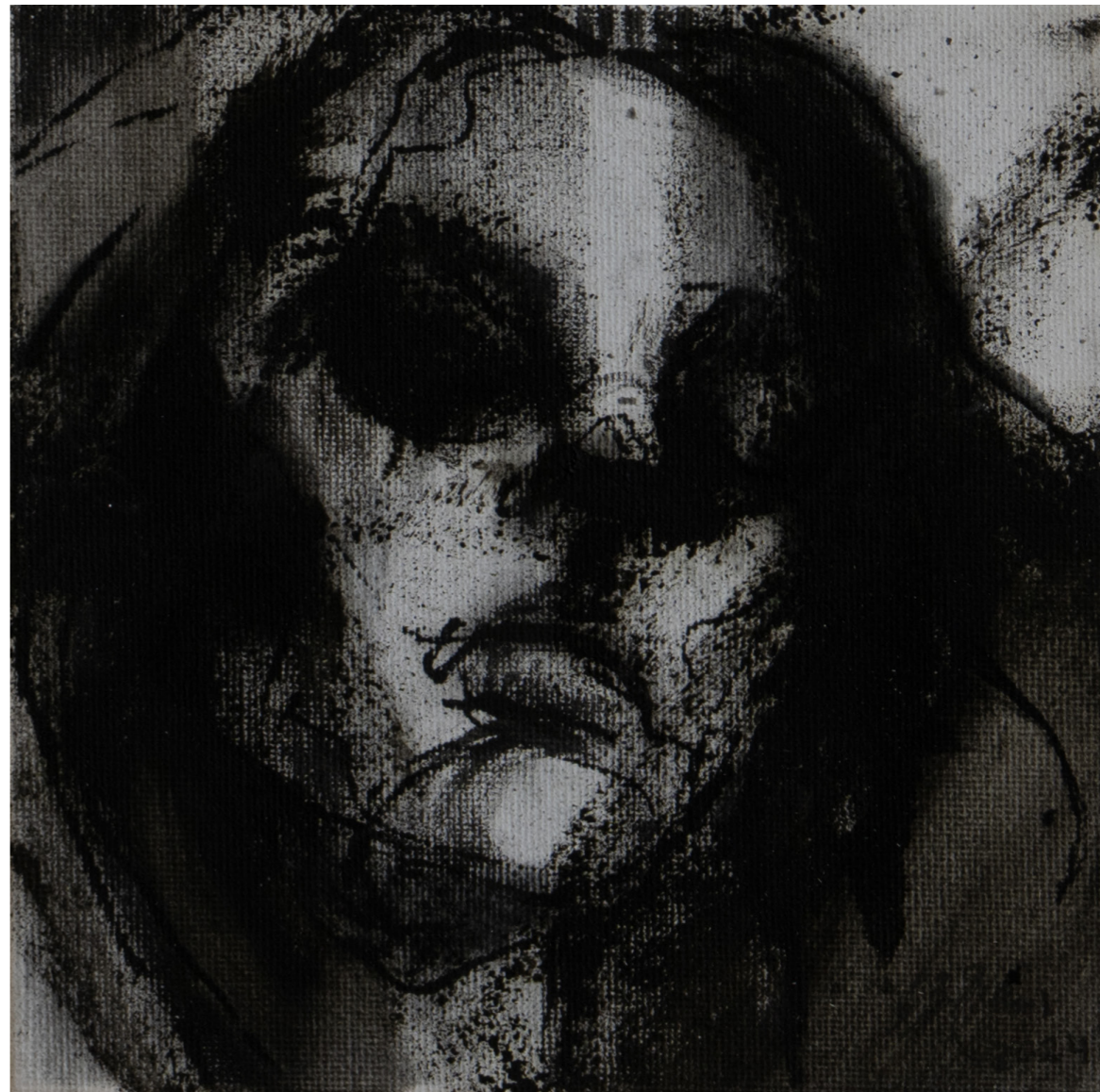
خامات متعددة على قماش Mixed media on canvas 15 x 15 cm