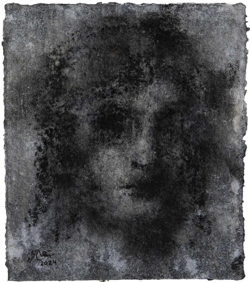
خامات متعددة على ورق مصنوع يدويًا Mixed media on handmade paper 30 x 26 cm