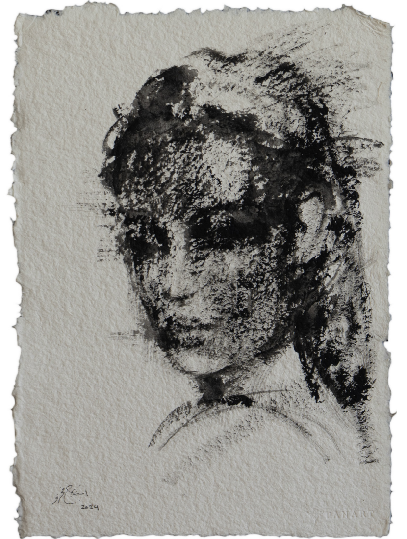
خامات متعددة على ورق مصنوع يدويًا Mixed media on handmade paper 43 x 30 cm