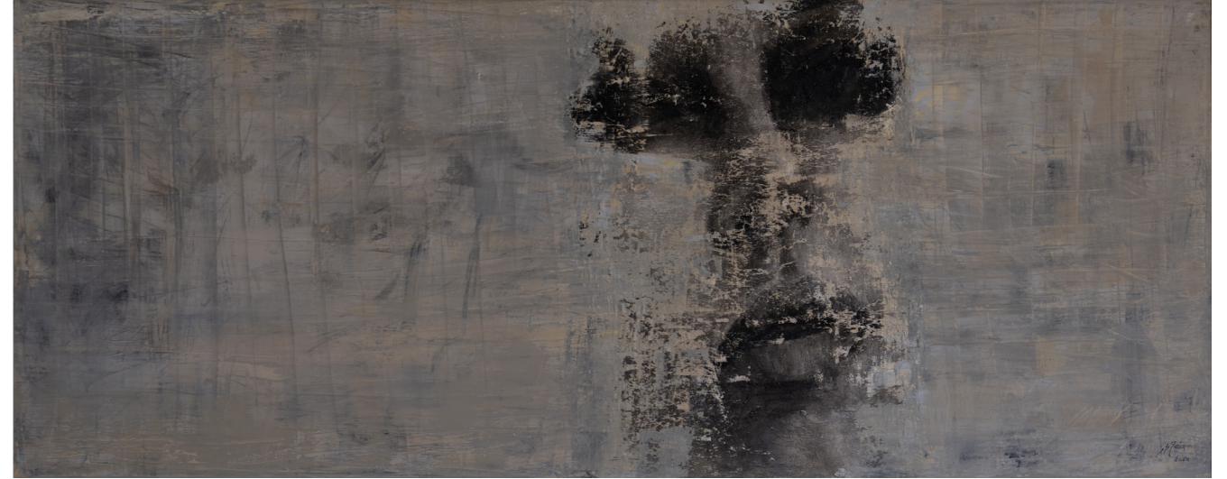
خامات متعددة على قماش Mixed media on canvas 200 x 80 cm