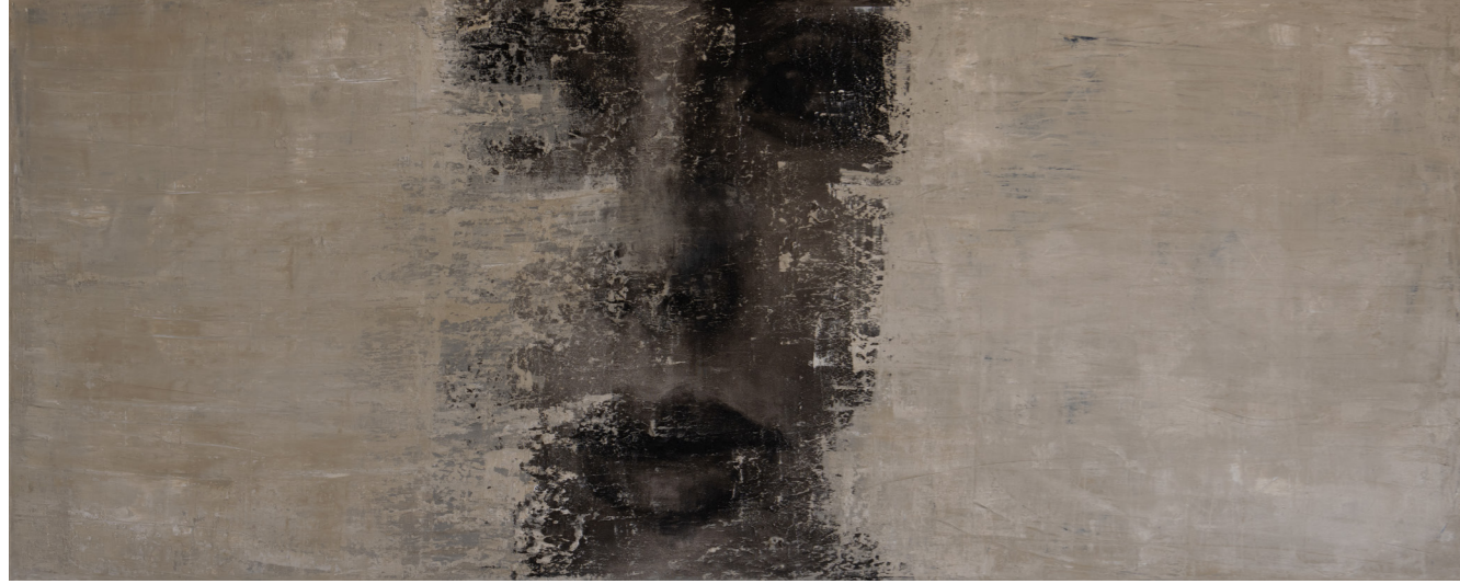
خامات متعددة على قماش Mixed media on canvas 200 x 80 cm