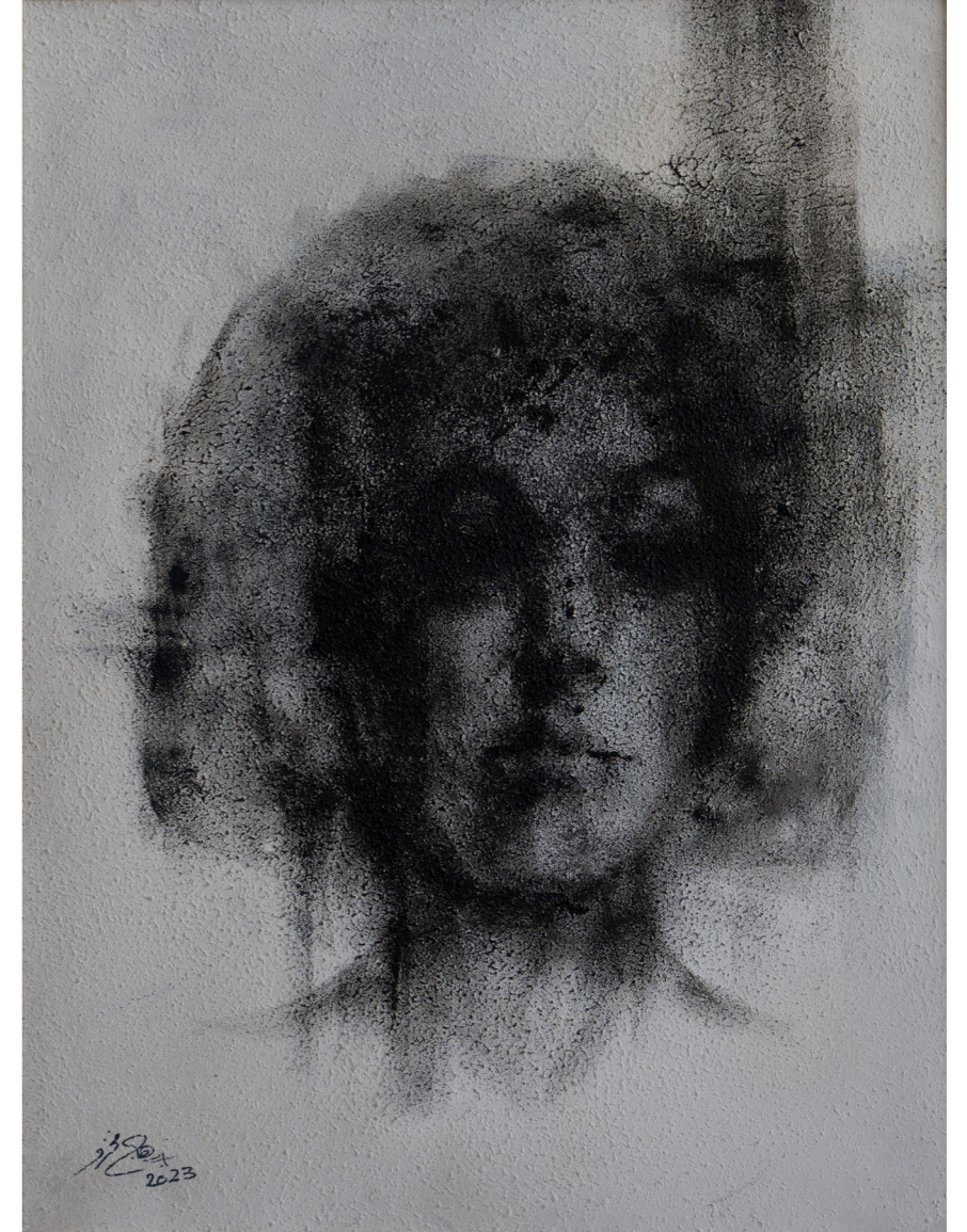
خامات متعددة على قماش Mixed media on canvas 50 x 50 cm