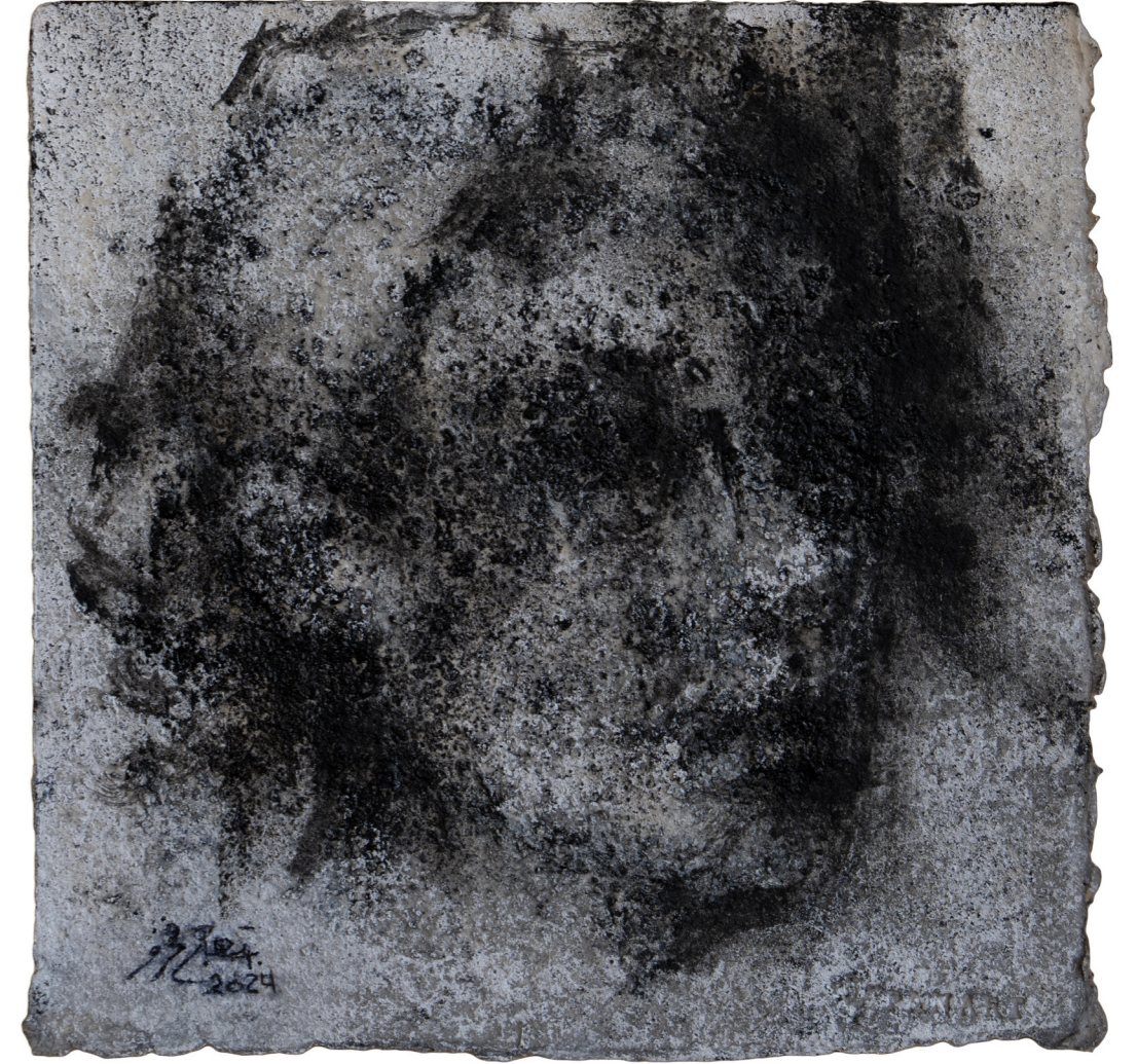
خامات متعددة على ورق مصنوع يدويًا Mixed media on handmade paper 30 x 30 cm