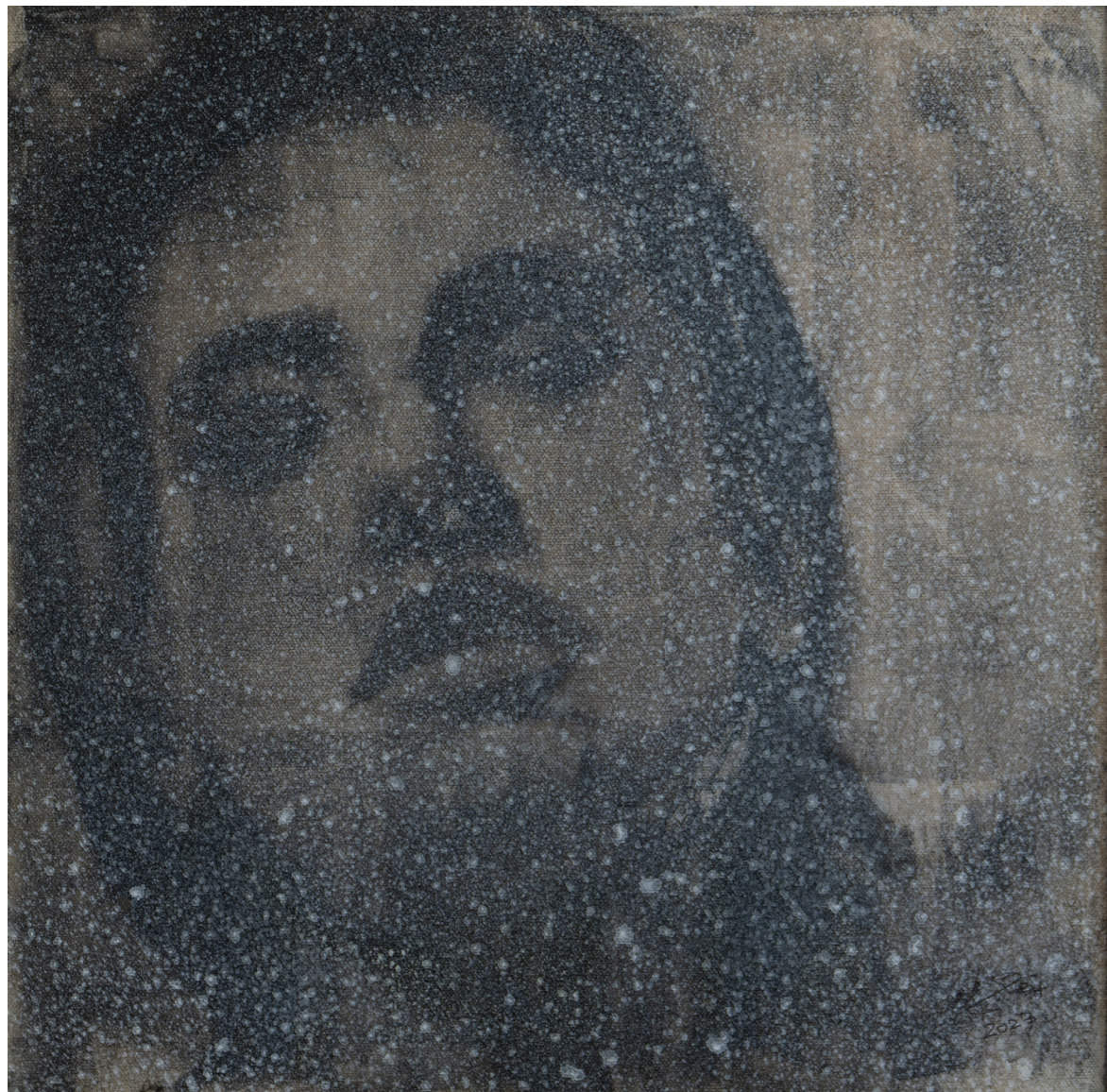
خامات متعددة على قماش Mixed media on canvas 40 x 40 cm