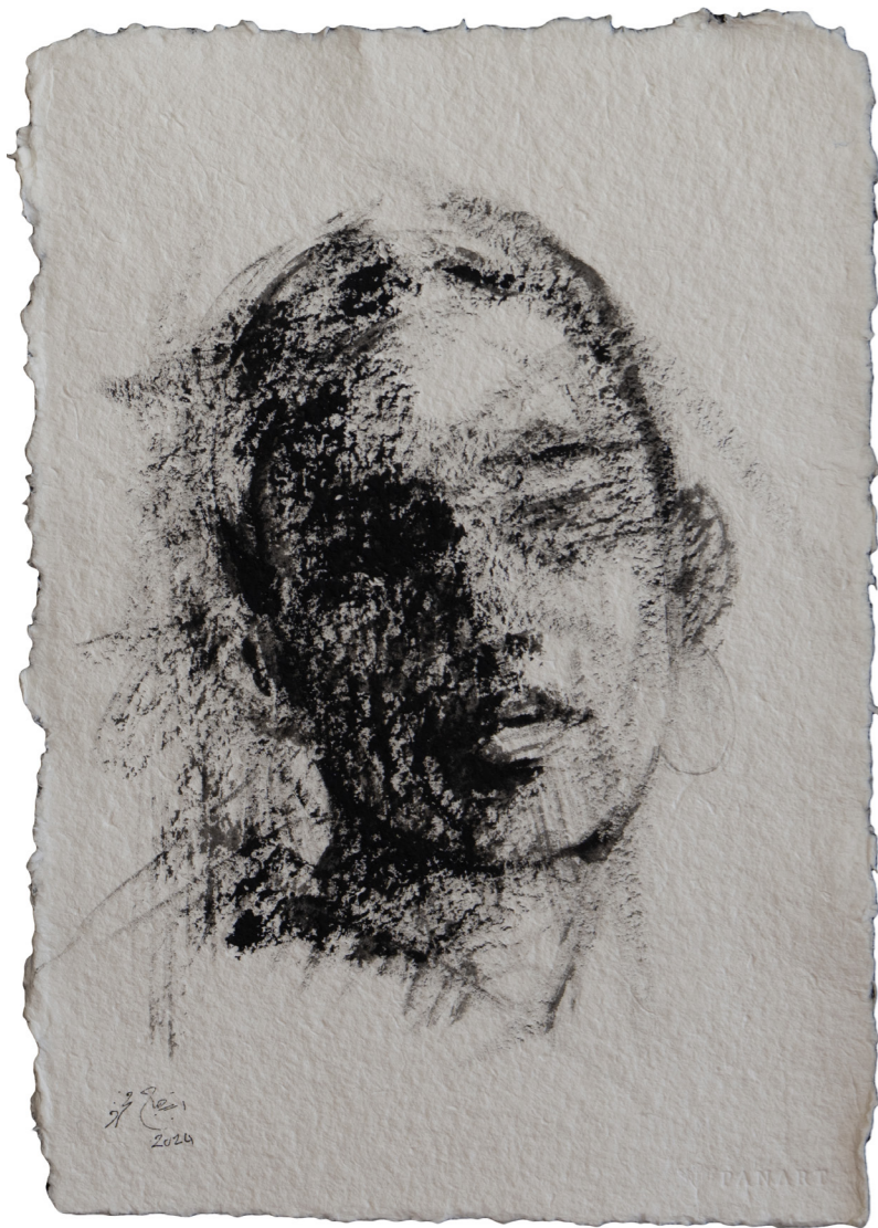
خامات متعددة على ورق مصنوع يدويًا Mixed media on handmade paper 43 x 30 cm