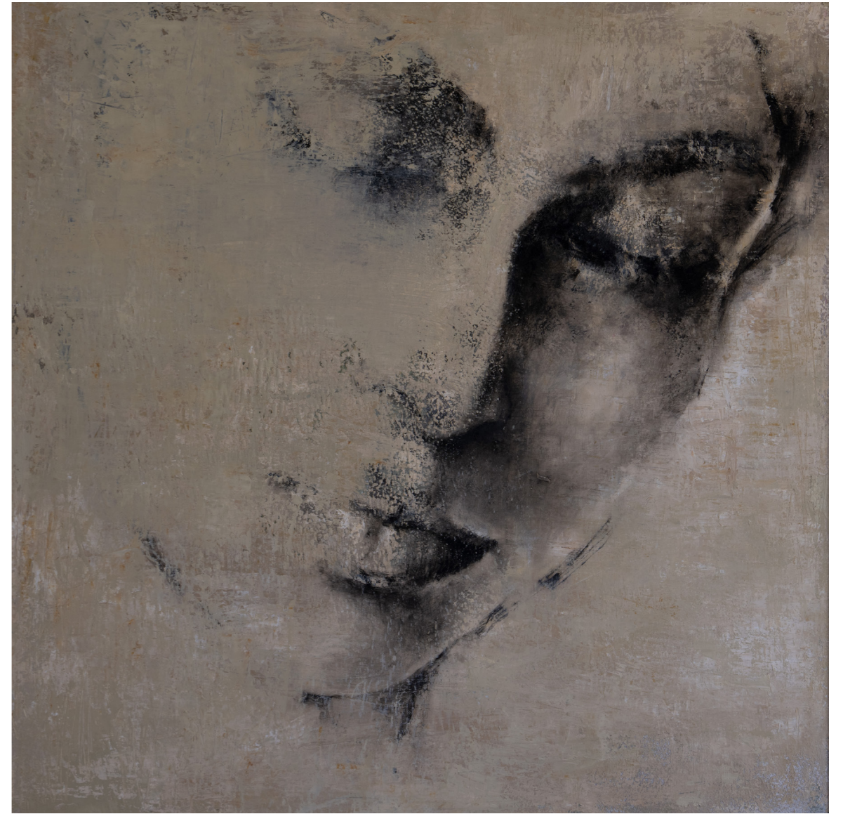
خامات متعددة على قماش Mixed media on canvas 120 x 120 cm