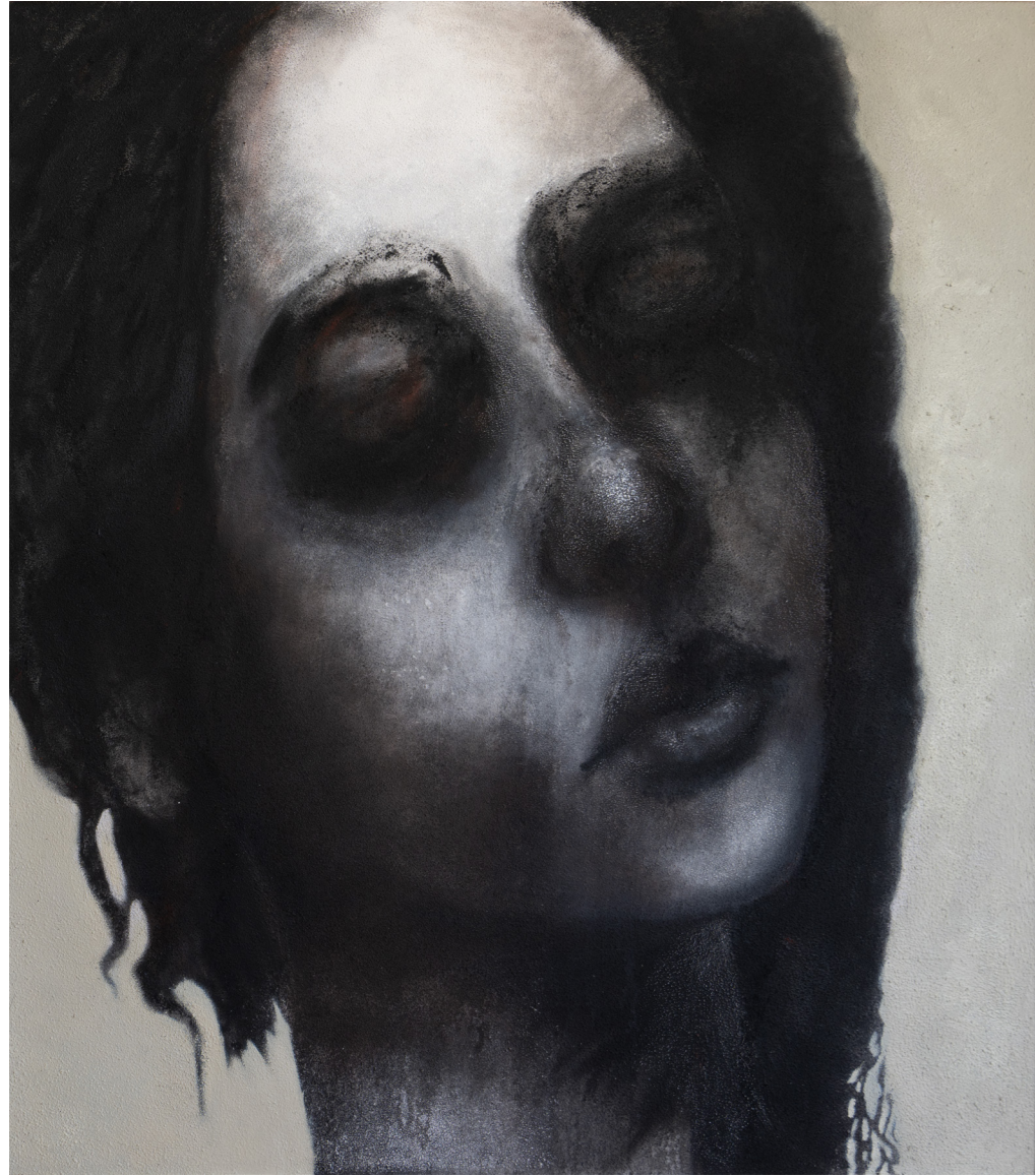
خامات متعددة على قماش Mixed media on canvas 180 x 160 cm