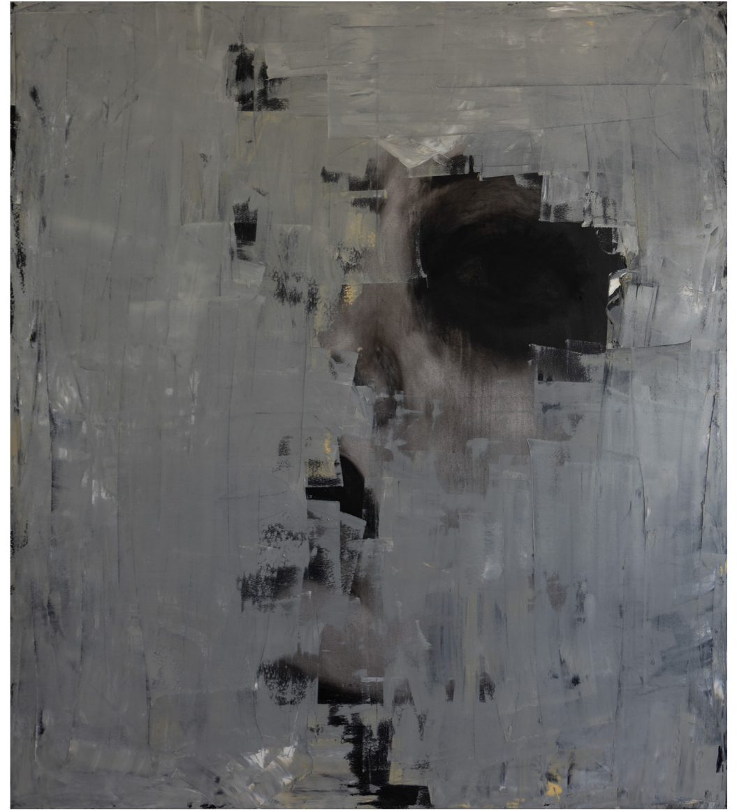
خامات متعددة على قماش Mixed media on canvas 180 x 160 cm