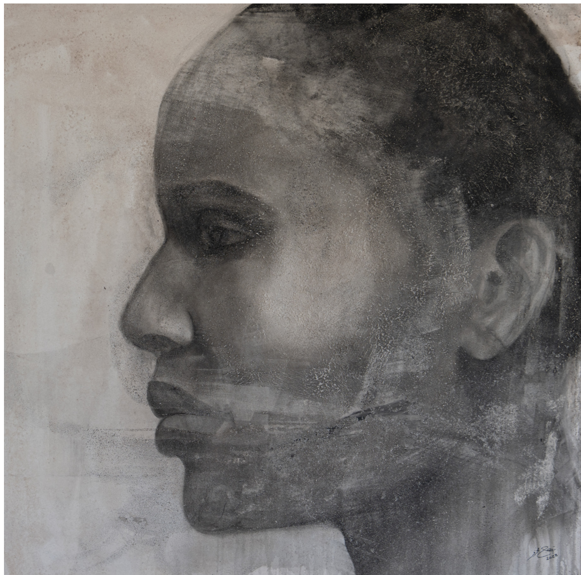
خامات متعددة على قماش Mixed media on canvas 120 x 120 cm