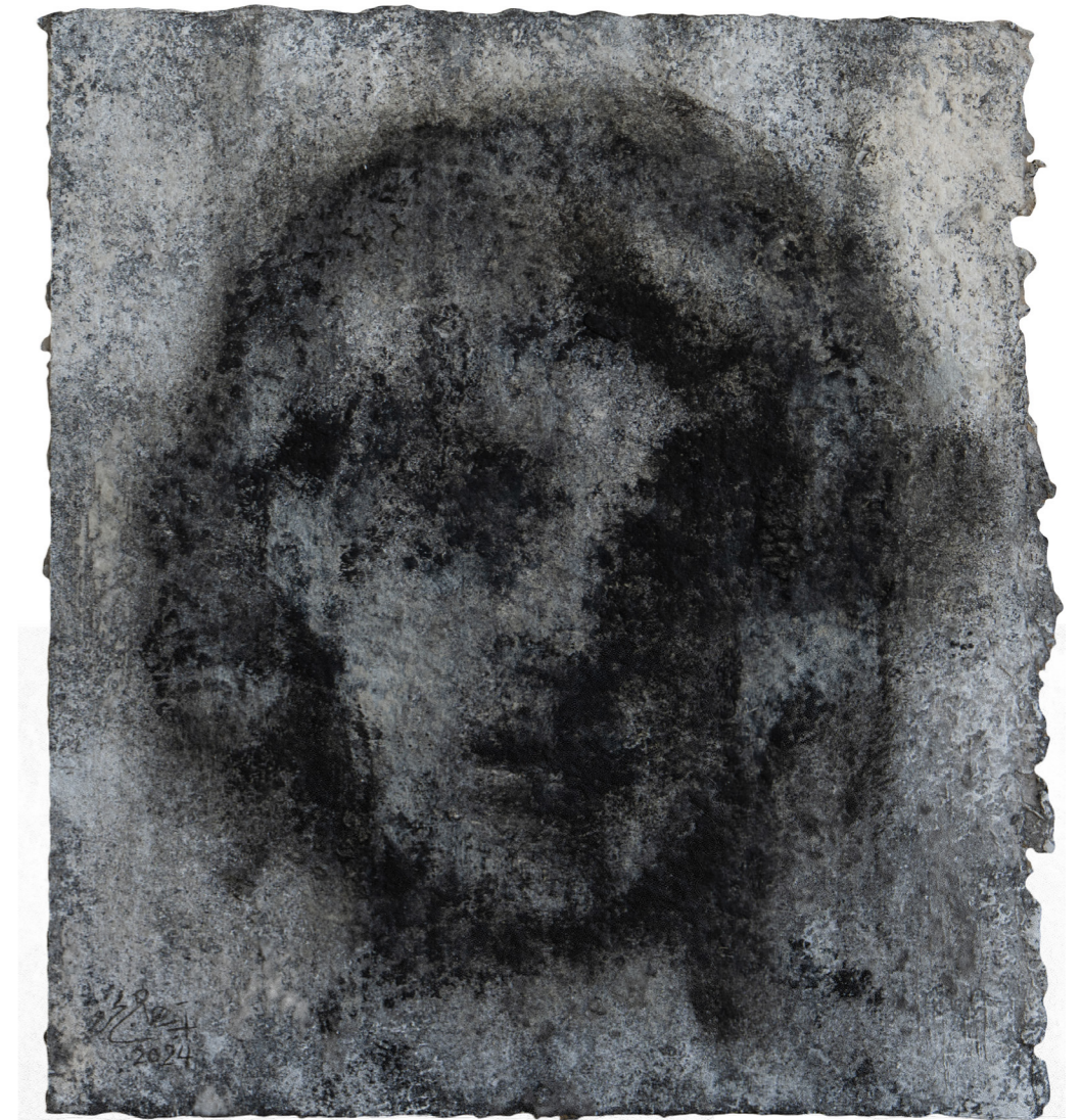
خامات متعددة على ورق مصنوع يدويًا Mixed media on handmade paper 30 x 30 cm