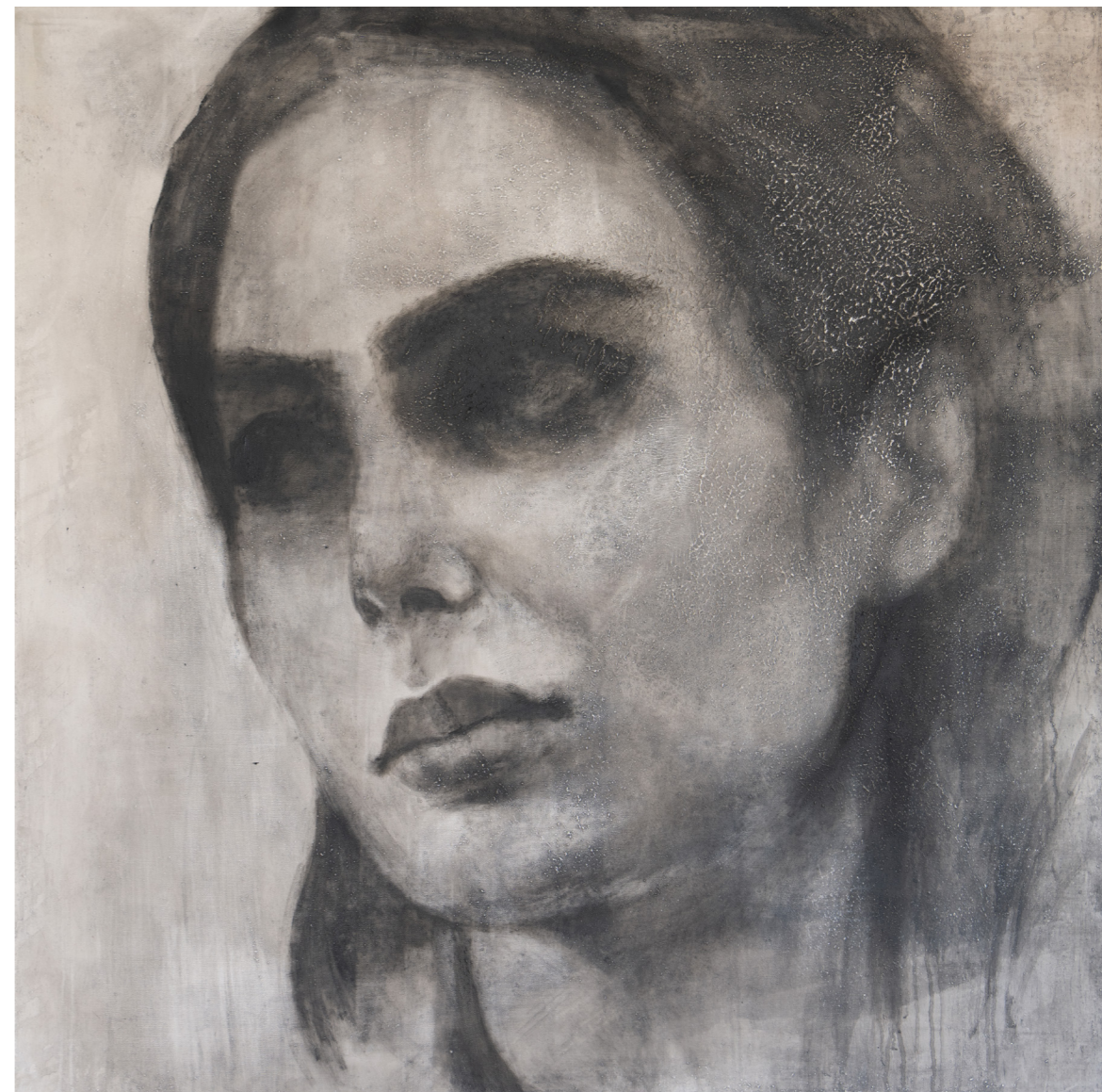
خامات متعددة على قماش Mixed media on canvas 120 x 120 cm