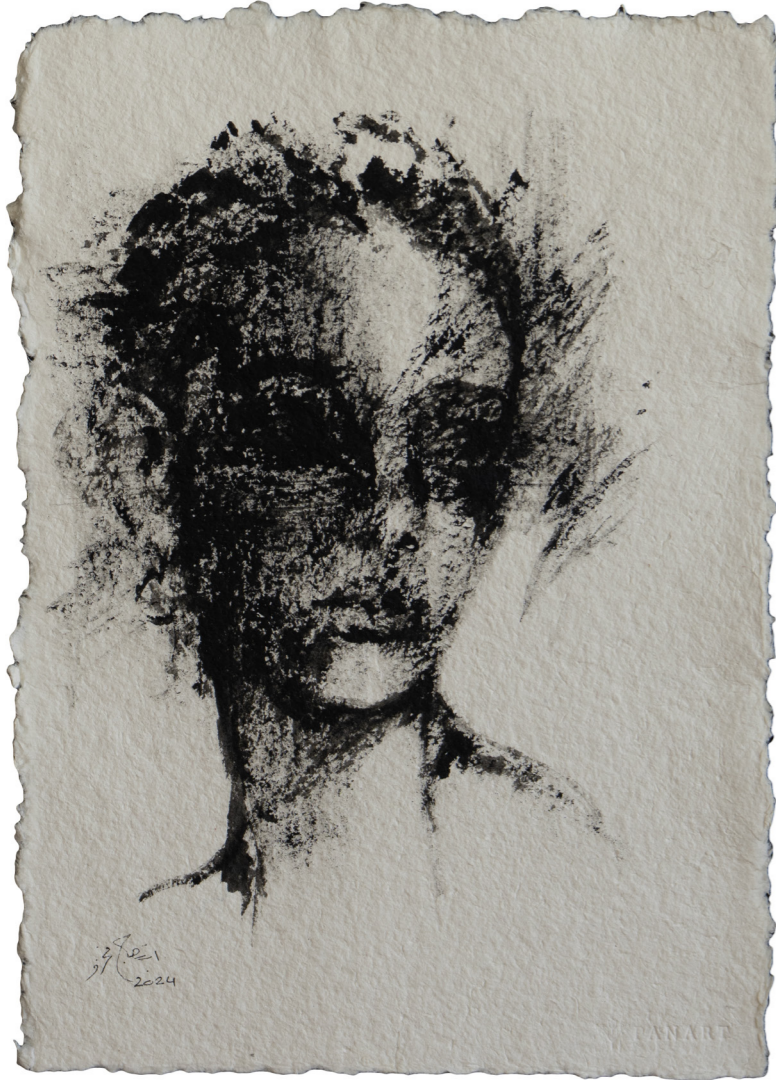
خامات متعددة على ورق مصنوع يدويًا Mixed media on handmade paper 43 x 30 cm