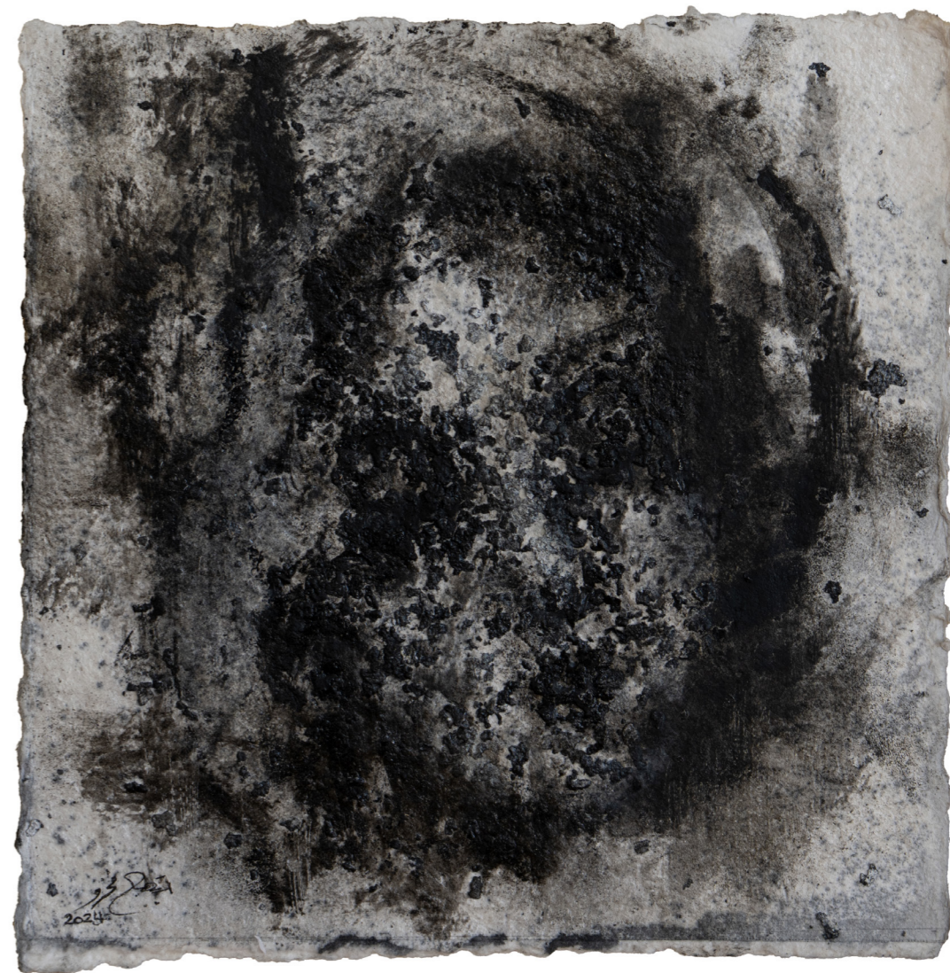
خامات متعددة على ورق مصنوع يدويًا Mixed media on handmade paper 30 x 30 cm