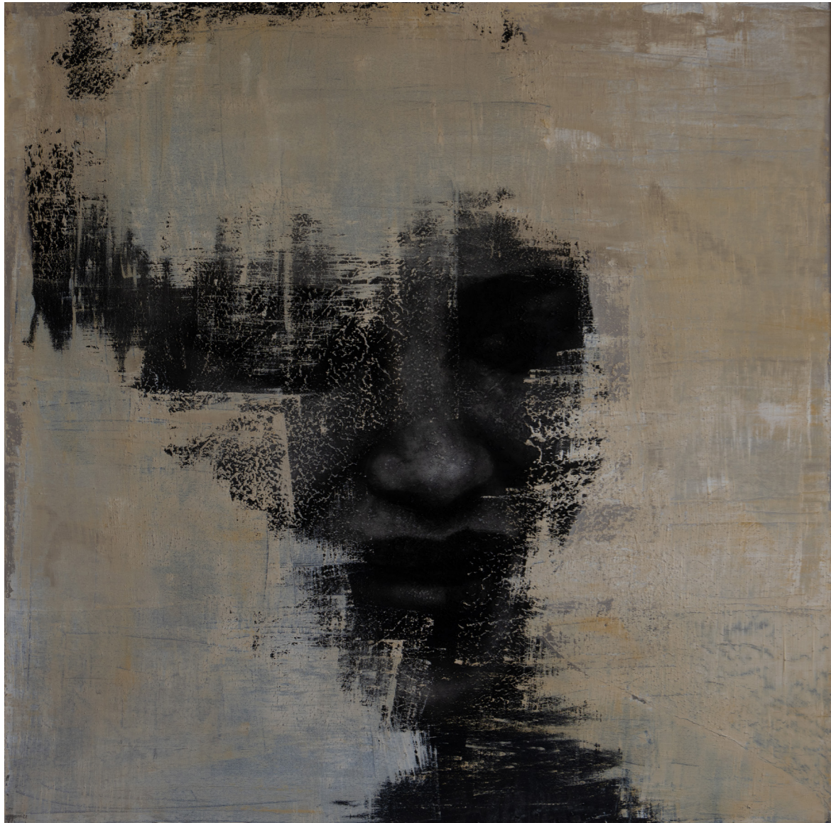
خامات متعددة على قماش Mixed media on canvas 120 x 120 cm